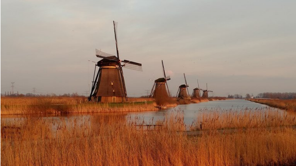
Figuur 1 Huidige “standaard foto”

géén van de meegeleverde stukken blijkt dat hier enige aandacht aan is geschonken. Om onderstaande 3d schets probeert BvLK de vergelijking te maken met de huidige situatie. Gemeente Molenwaard heeft aangegeven een meer realistische weergave te maken van de nieuw te plaatsen schuur in relatie tot de omgeving. Helaas is daar tot op heden geen reactie op gekomen.